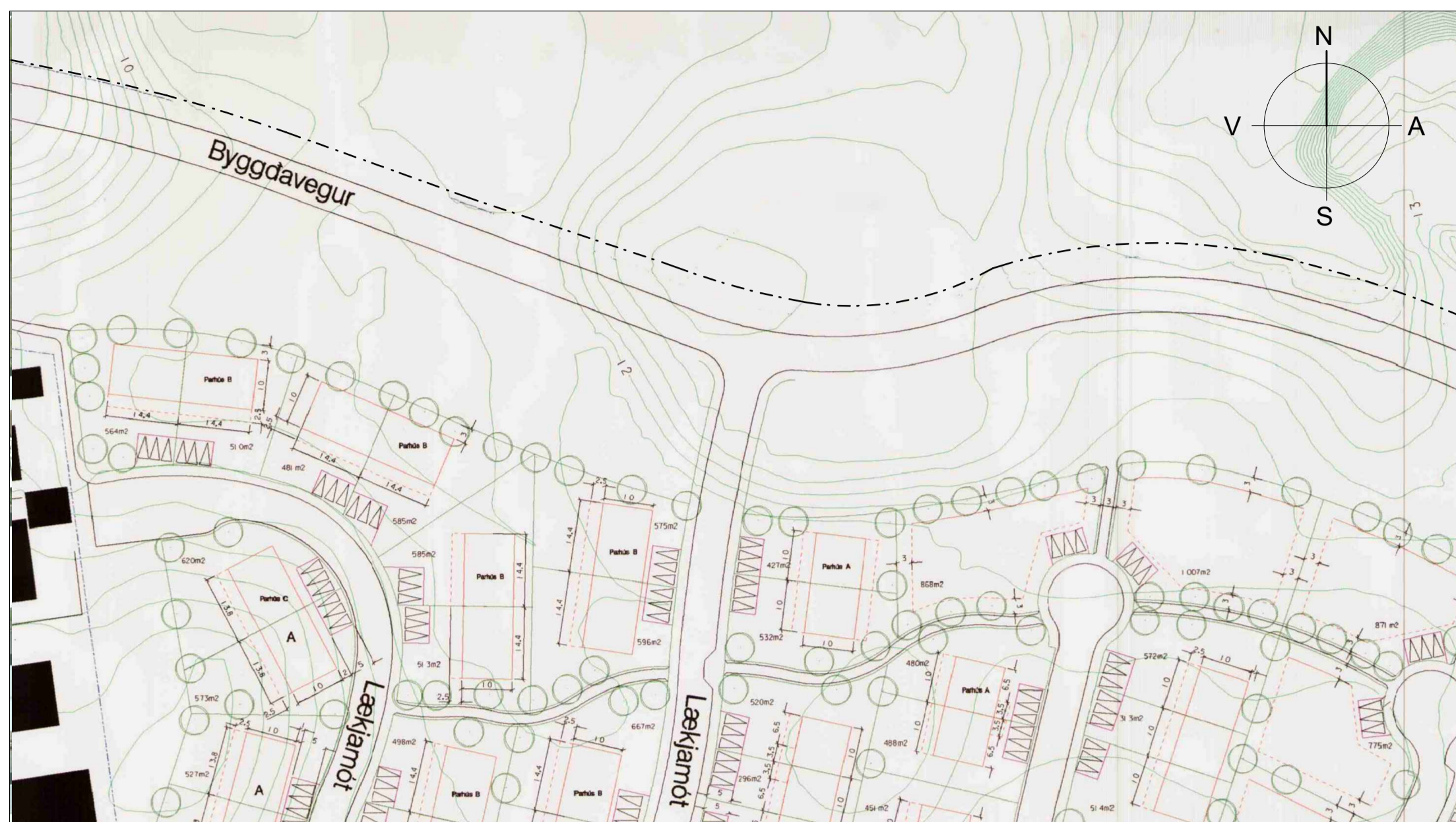
Gildandi deiliskipulag Lækjamóta og umhverfis, samþykkt 21. maí 2003 Mkv. 1:1000