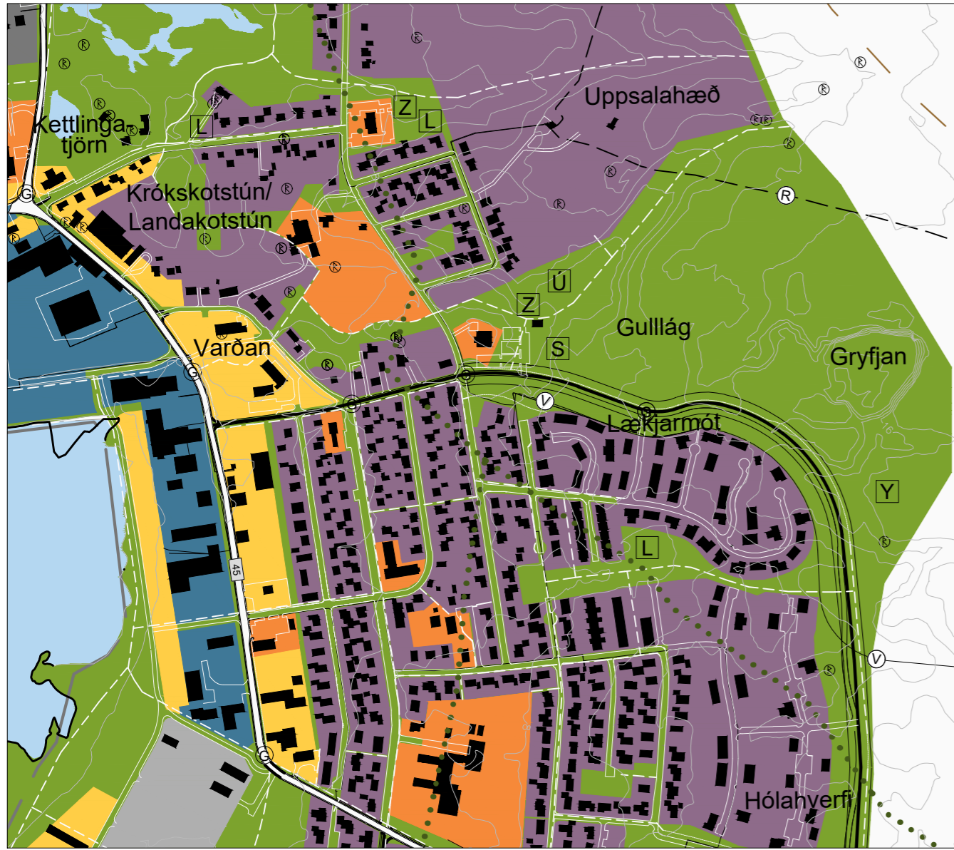
Aðalskipulag Sandgerðisbæjar 2008-2024, staðfest. 8 mars 2011 Þéttbýlisuppdráttur Mkv:1:7500