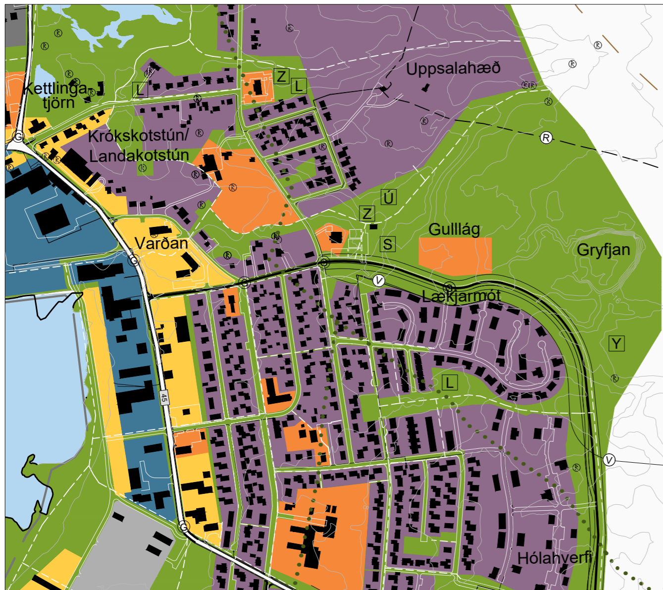
Tillaga að breytingu á Aðalskipulag Sandgerðisbæjar 2008-2024. Nýtt svæði fyrir þjónustustofnanir við Byggðaveg Þéttbýlisuppdráttur Mkv:1:7500