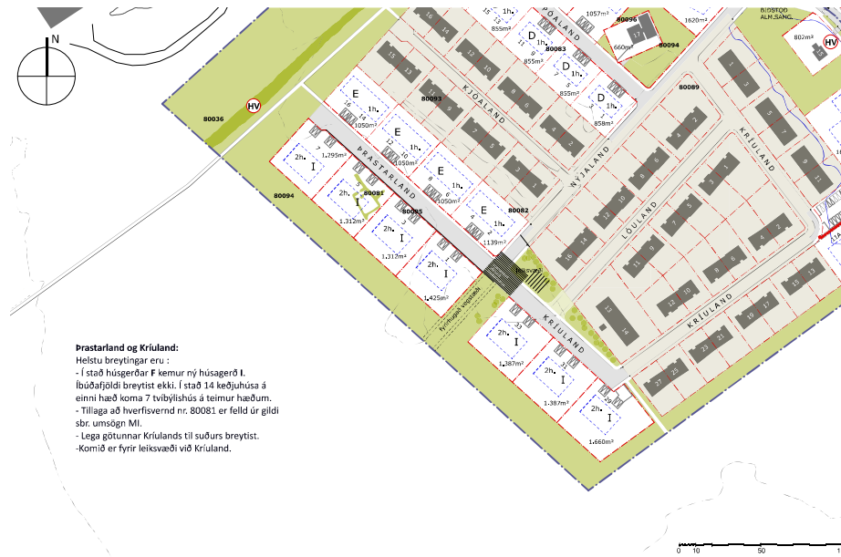
TILLAGA AÐ BREYTTU DEILISKIPULAGI, mkv. 1:1500

Prastarland og Krúlland: Helstu breytingar eru : - Í stað húsgarðar F kemur ný húsgarð I. - Íbúðafjöldi breytist ekki. Í stað 14 keðjuhúsa á einni hæð koma 7 tvíbýlishús á tveimur hæðum. - Tillaga að hverfisvernd nr. 80081 er felld úr gildi sbr. umsögn MÍ. - Lega götumar Krúllands til suðurs breytist. - Kornöð er fyrir leiksvæði við Krúlland.