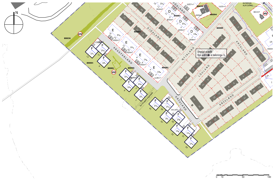
GILDANDI DEILISKIPULAG, mkv. 1:1500