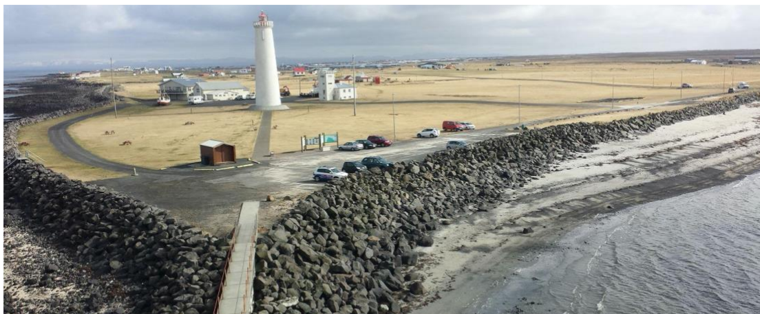
Mynd 2 Skipulagssvæðið til hægri