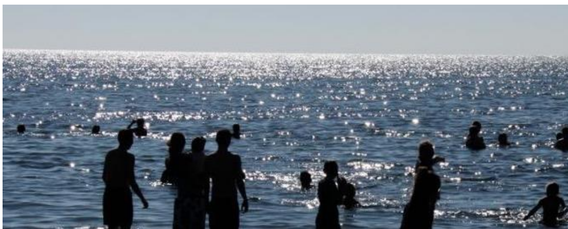
Mynd 4 Dæmi um notkun sem þarfnast aðstöðubyggingar