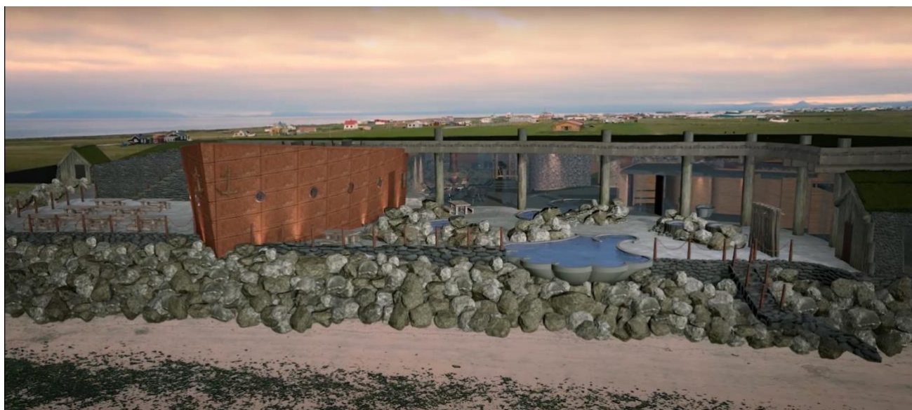
Mynd 6 Hugmynd að heilsulind – ámynd til vesturs