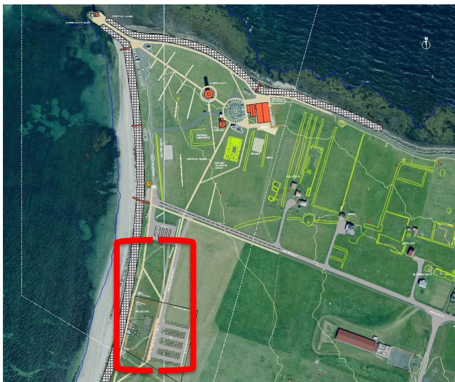
Mynd 5 Yfirlitsmynd – drög að fyrirkomulagi